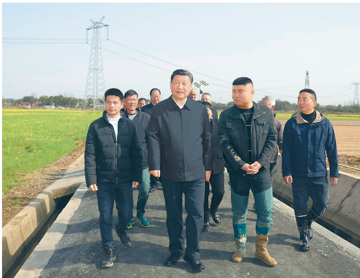
3月18日至21日，中共中央总书记、国家主席、中央军委主席习近平在湖南考察。这是19日下午，习近平在常德市鼎城区谢家铺镇港中坪村，同种粮大户、农技人员、基层干部亲切交流。

新华社长沙3月21日电 中共中央总书记、国家主席、中央军委主席习近平近日在湖南考察时强调，湖南要牢牢把握自身在构建新发展格局中的战略定位，坚持稳中求进工作总基调，坚持高质量发展不动摇，坚持改革创新、求真务实，在打造国家重要先进制造业高地、具有核心竞争力的科技创新高地、内陆地区改革开放高地上持续用力，在推动中部地区崛起和长江经济带发展中奋勇争先，奋力谱写中国式现代化湖南篇章。