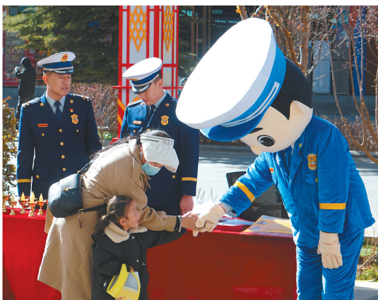
3月15日，“3·15国际消费者权益日”集中宣传活动在拉萨市城关区宇拓路举行。活动以“激发消费活力”为主题，现场发放了消费维权宣传材料、宣传品，解答了群众消费维权问题，讲解了消费维权知识。

为此，我区商务部门拟实施稳定大宗消费等“五大行动”，开展“幸福西藏·乐享生活”等16项特色促进消费活动，不断开拓消费新领域、创新消费新模式、推出消费新产品、丰富消费供给、改善消费环境，进一步增强消费对经济发展的基础性作用，更好满足人民群众改善生活的需要。