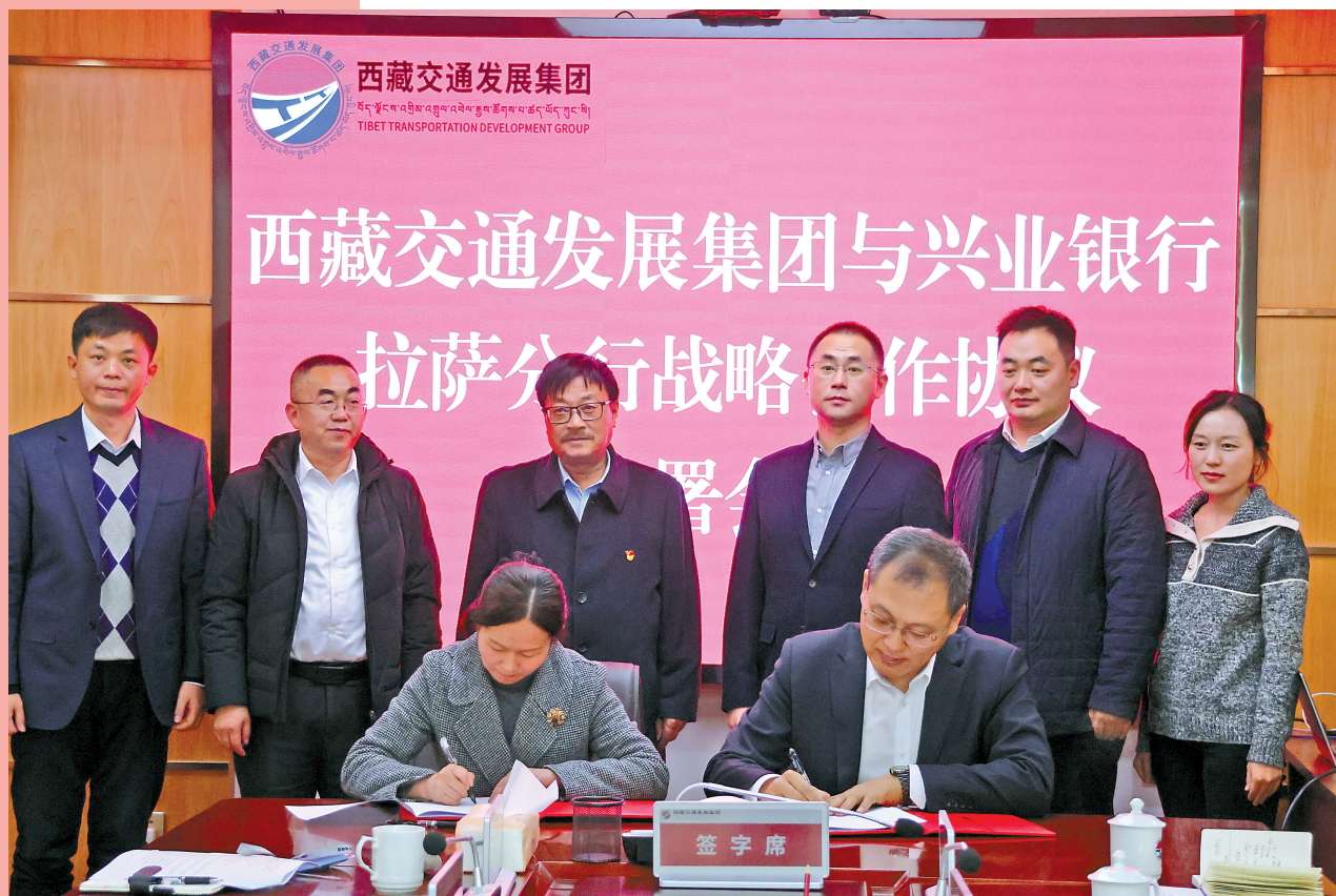
▲兴业银行拉萨分行与企业签署战略合作协议。

中央金融工作会议明确提出,做好科技金融、绿色金融、普惠金融、养老金融、数字金融五篇大文章。为推进金融高质量发展,走中国特色金融发展之路指明了方向。兴业银行拉萨分行积极践行金融的政治性和人民性,打造“有担当、有特色、有温度”的银行。 发力普惠小微金融。小微企业是发展的生力军,就业的主渠道,创新的重要源泉。面对普惠小微企业融资难、融资慢的问题,分行分类施策、精准发力。针对区内不同普惠小微企业的经营实际和还贷能力,分行推出“连连贷”“循环贷”等特色产品;针对无抵押无担保小微企业,分行以知识产权质押、应收账款质押等担保方式,解决小微企业“担保难、融资难”的问题。同时,分行打造了全区第一家集贷款咨询、产品设计、资料收件、流程审批、放款作业等于一体的普惠金融服务中心,推动小微企业金融服务工作进一步提质上量。至2023年末,兴业银行拉萨分行普惠贷款首次实现亿元突破达1.3亿元,较年初增长254%。 加大绿色金融供给。绿色发展和“双碳”目标的实现,离不开绿色金融的坚实后盾。兴业银行是国内首家赤道银行,也是国内最早探索绿色金融的商业银行。兴业银行拉萨分行始终秉承绿色发展理念,积极把握西藏建设国家清洁能源基地的重大机遇,以“风光水”产业发展为切口,抓住点、发展链、服务面,加快布局“风光水”绿色金融发展,夯实绿色银行底色。至2023年末,兴业银行拉萨分行绿色贷款较上年度增长2.2倍达4.4亿元,高于全区绿色贷款增速。 塑造客户卓越体验。兴业银行拉萨分行始终坚持“真诚服务,相伴成长”的服务理念,提升服务质效。打造双语服务窗口。率先对分行营业厅所有非重要空白凭证,宣传折页进行了藏汉双语对照翻译,所有自助机具加载了藏语模块,为藏族同胞办理业务提供方便。针对高原地区突发疾病高发的特点,兴业银行拉萨分行率先在营业网点配置了AED(自动体外除颤仪),并开展AED使用技能培训,让营业场所人员熟练掌握紧急救援技能,时时刻刻守护客户健康。开辟“惠民驿站”专区,向社会公众提供饮用水、微波炉、打印复印等40余种便民服务,贴心服务新市民,特别是快递、环卫、出租车司机等“流动型”作业人群。 志行万里者,不中道而辍足。兴业银行拉萨分行将始终胸怀“国之大者”,践行初心使命,深入贯彻落实中央金融工作会议精神,锚定金融强国建设目标,聚焦“五篇大文章”,矢志在西藏高质量发展的画卷上,奋笔书写“兴”篇章。