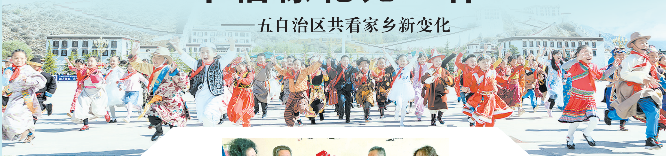
参加西藏百万农奴解放纪念日活动。身穿各民族服饰的拉萨市第一小学学生