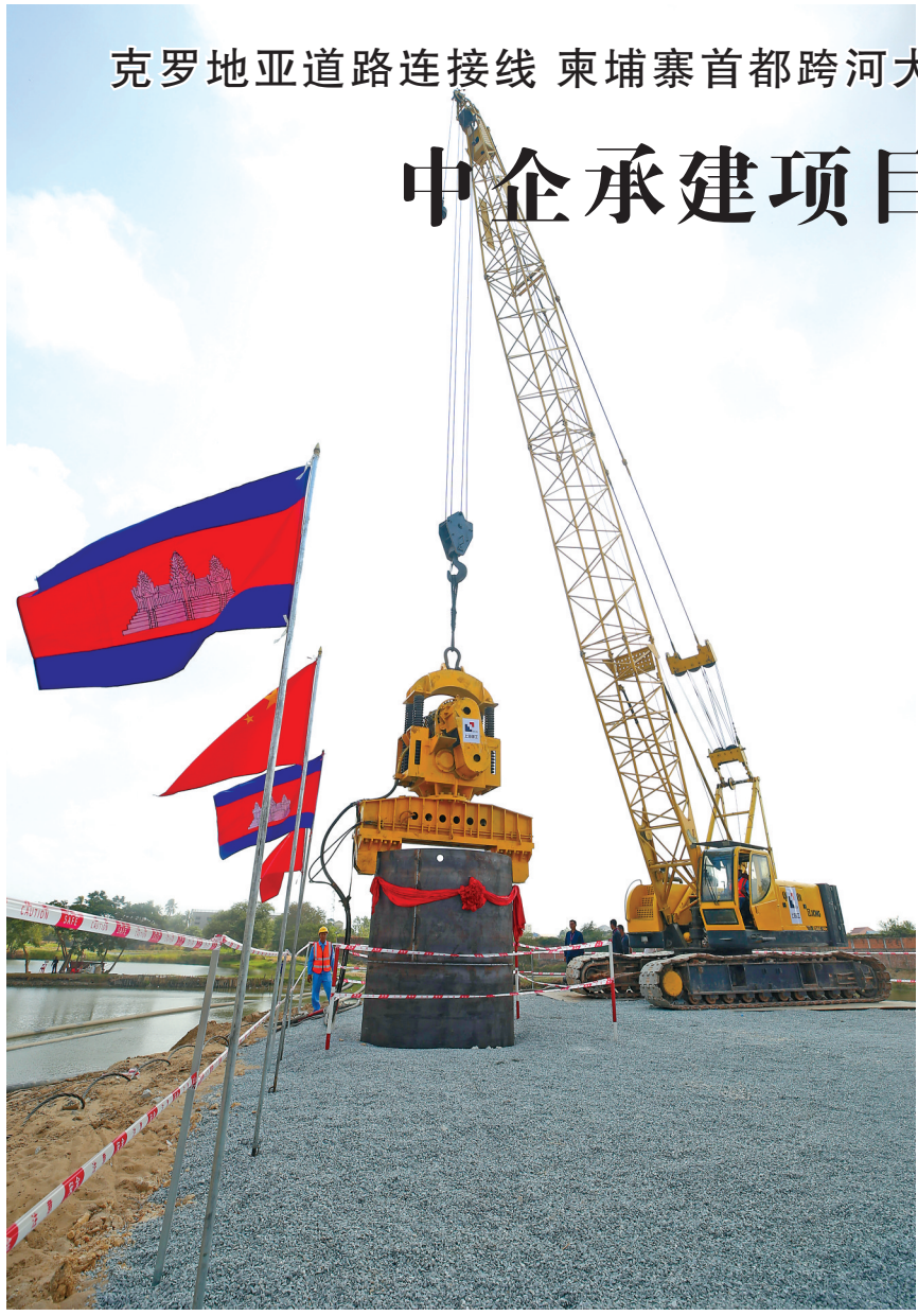
上图:为2月19日,工程车辆在柬埔寨金边的百达隆巴萨河大桥项目现场施工。