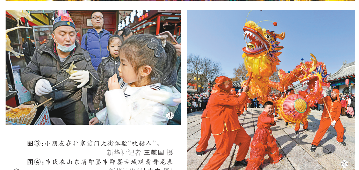
小朋友在北京前门大街体验“吹糖人”。