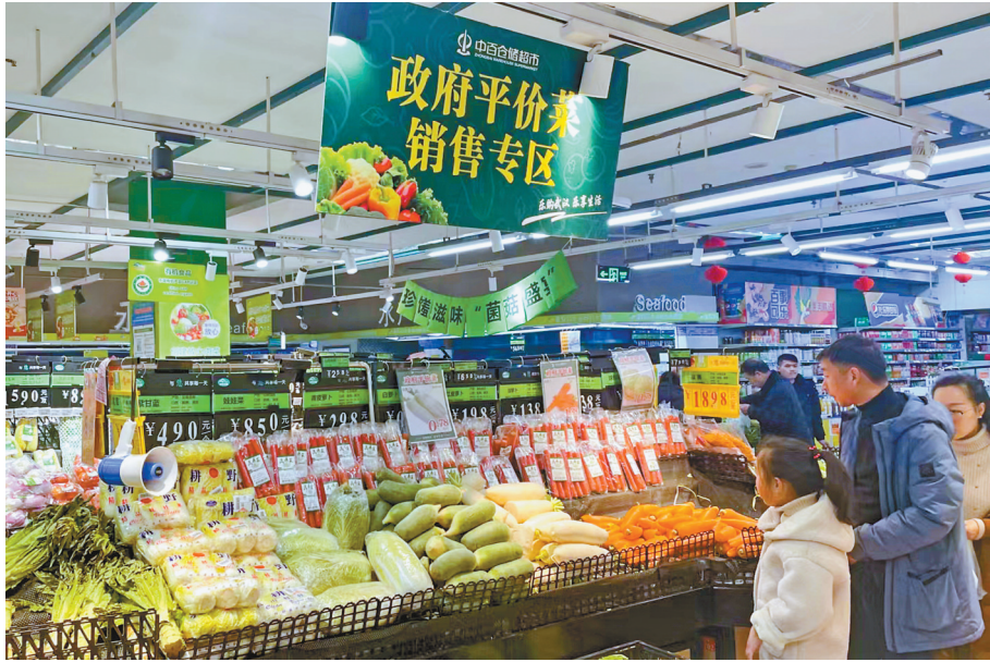
图为市民在湖北武汉市中百仓储黄陂购物广场店选购(2月11日摄)。