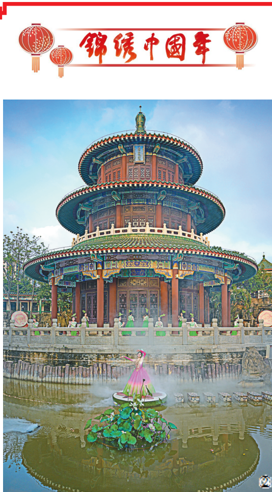
在传统庙会上体验民俗,为新年祈福;到新春灯会上赏灯,品味流光溢彩;在热闹的大集和展会上挑选礼物,寄托对亲朋的牵挂。

各地游客在热闹红火的氛围中,感受浓浓年味。 图①:游客在湖北省襄阳市唐城景区观看板凳龙灯巡游表演(无人机照片)。 图②:位于海南省海口市的第十六届万春会分会场——海瑞文化公园春节系列活动中拍摄的舞蹈表演。