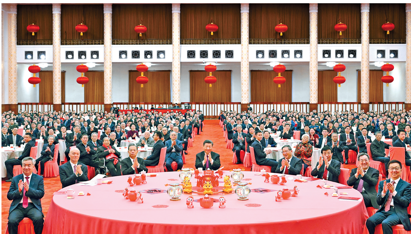
2月8日,中共中央、国务院在北京人民大会堂举行2024年春节团拜会。中共中央总书记、国家主席、中央军委主席习近平发表讲话。