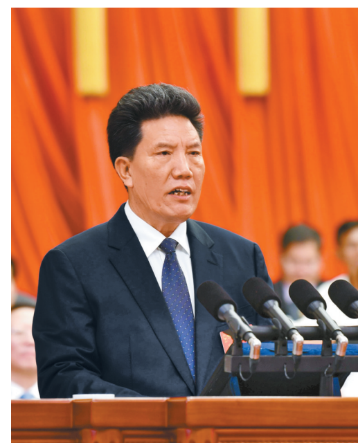
全国人大常委会副委员长、自治区人大常委会主任洛桑江村向大会作自治区人大常委会工作报告。本报记者 次仁平措 摄