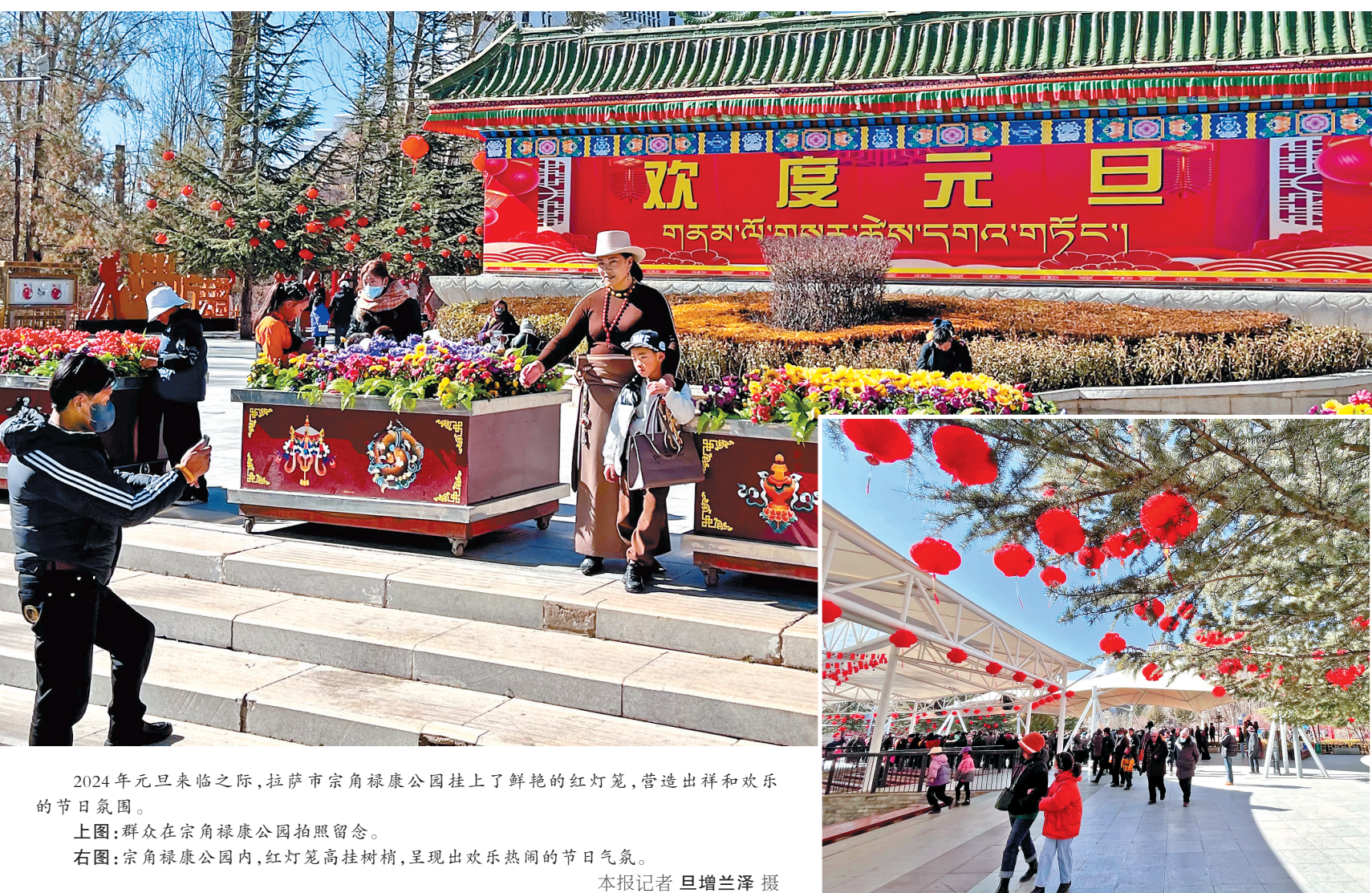
2024年元旦来临之际,拉萨市宗角禄康公园挂上了鲜艳的红灯笼,营造出祥和欢乐的节日氛围。