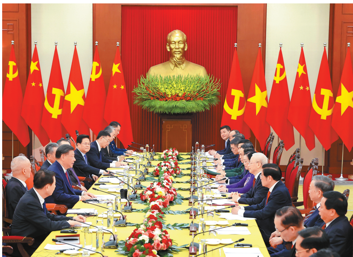
当地时间十二月十二日下午，刚刚抵达河内的中共中央总书记、国家主席习近平在越共中央驻地同越共中央总书记阮富仲举行会谈。