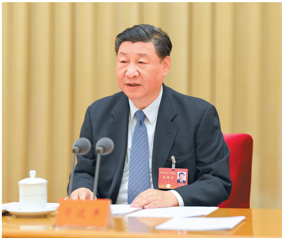
12月11日至12日，中央经济工作会议在北京举行。中共中央总书记、国家主席、中央军委主席习近平出席会议并发表重要讲话。

新华社北京12月12日电 中央经济工作会议12月11日至12日在北京举行。中共中央总书记、国家主席、中央军委主席习近平出席会议并发表重要讲话。中共中央政治局常委李强、赵乐际、王沪宁、蔡奇、丁薛祥、李希出席会议。