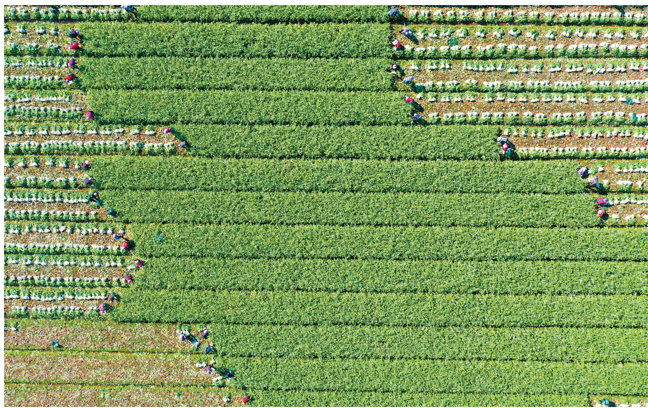
▲11月22日,在浙江省温岭市石桥头镇蔬菜基地,农民在采收高脚白菜(无人机照片)。