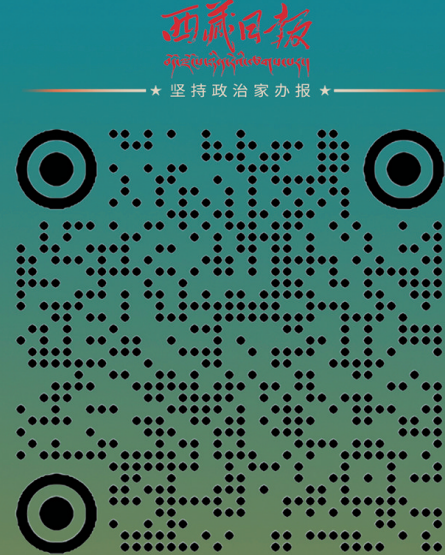
西藏发布微信公众号