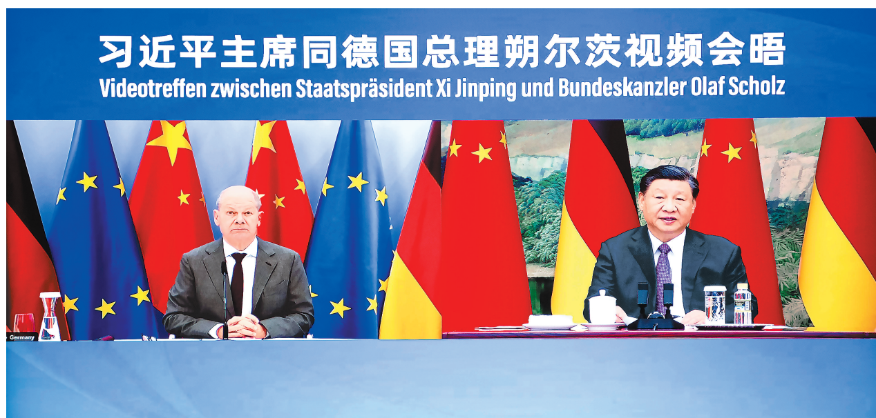
习近平主席同德国总理朔尔茨视频会晤 Videotreffen zwischen Staatspräsident Xi Jinping und Bundeskanzler Olaf Scholz