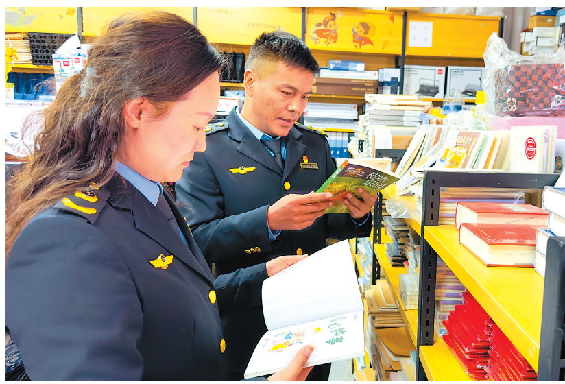
图为山南市琼结县市场监督管理局执法人员在某书店检查。