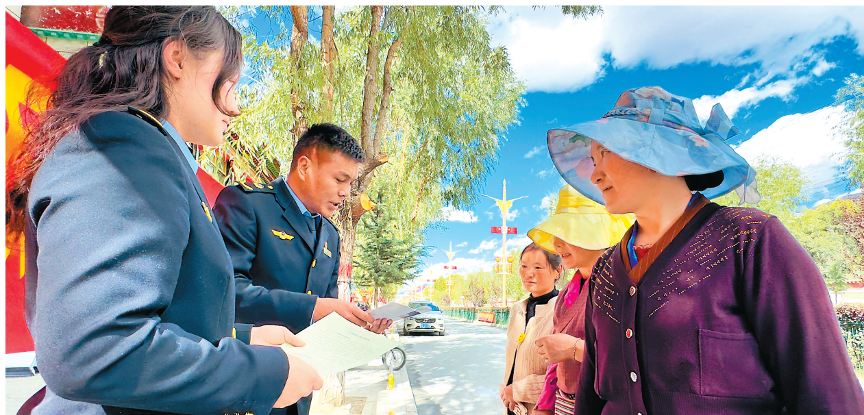
图为山南市琼结县市场监督管理局执法人员向群众发放知识产权相关宣传册。

近年来，自治区党委、政府高位推动知识产权相关工作，不断加强顶层设计，2022年，自治区市场监管联席会议制定了《西藏自治区贯彻〈知识产权强国建设纲要（2021—2035年）〉的实施方案》，出台《西藏自治区贯彻落实〈知识产权强国建设纲要（2021—2035年）〉“十四五”国家知识产权保护和运用规划》2022年推进计划》，组织编制《西藏自治区“十四五”知识产权保护和运用规划》等措施举措，为全区知识产权工作的开展提供指引。