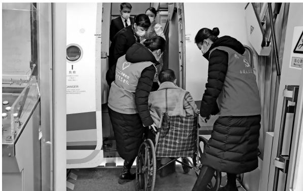
图为西藏航空地服人员帮助特殊旅客登机。

面对航空运输市场的稳步恢复,加之春节假期延长和春节、藏历新年假期重叠、南北旅游热等实际,西藏航空持续优化服务流程细节,全方位保障好地面和机上服务各环节工作。针对藏族旅客、首乘旅客、老年旅客、无陪儿童等特殊需求旅客,安排专人做好信息传递与服务保障;在机舱创新推出藏式奶咖、雪域奶茶等“藏历新年限定”特色饮品,与云南白竹山联名推出“品味云端”茶礼,既丰富了旅客乘机体验,也为民族地区乡村振兴注入新活力;建立客服分梯度排班及备份运行保障制度,精准高效处理旅客各类诉求;各运行保障单位全面加强协作,落实落细各项应急准备