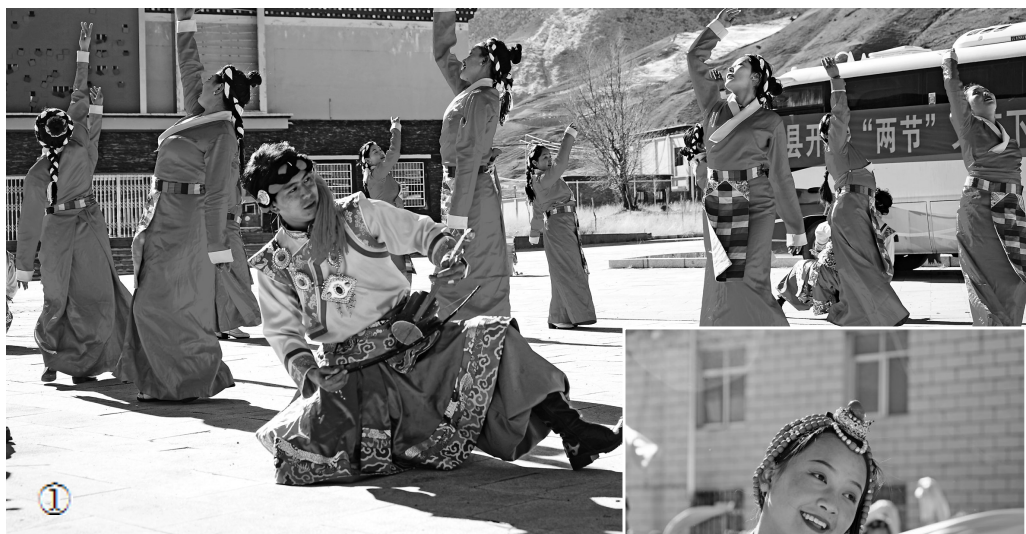
图①②:文艺下乡演出现场。